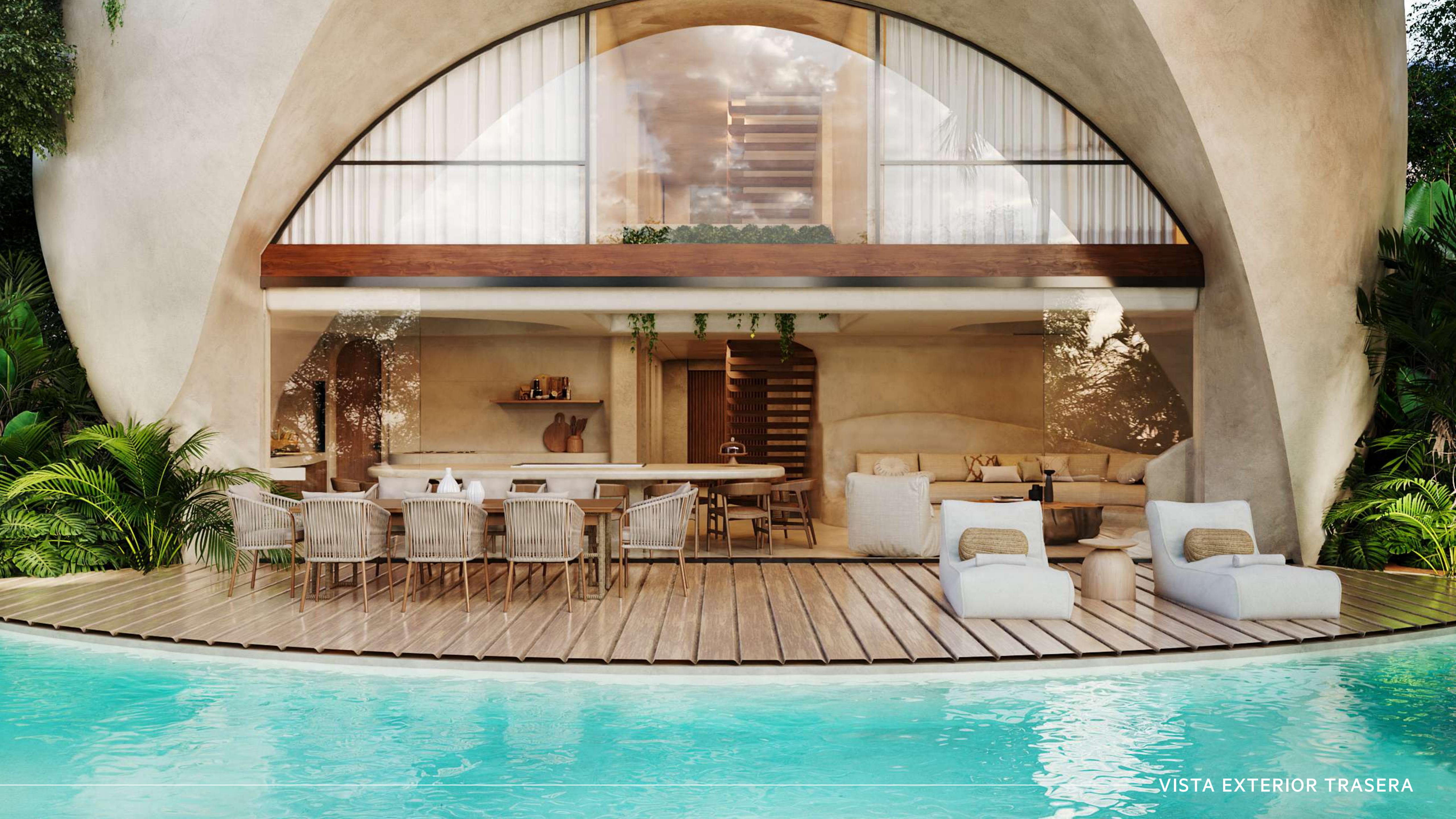
VISTA EXTERIOR TRASERA