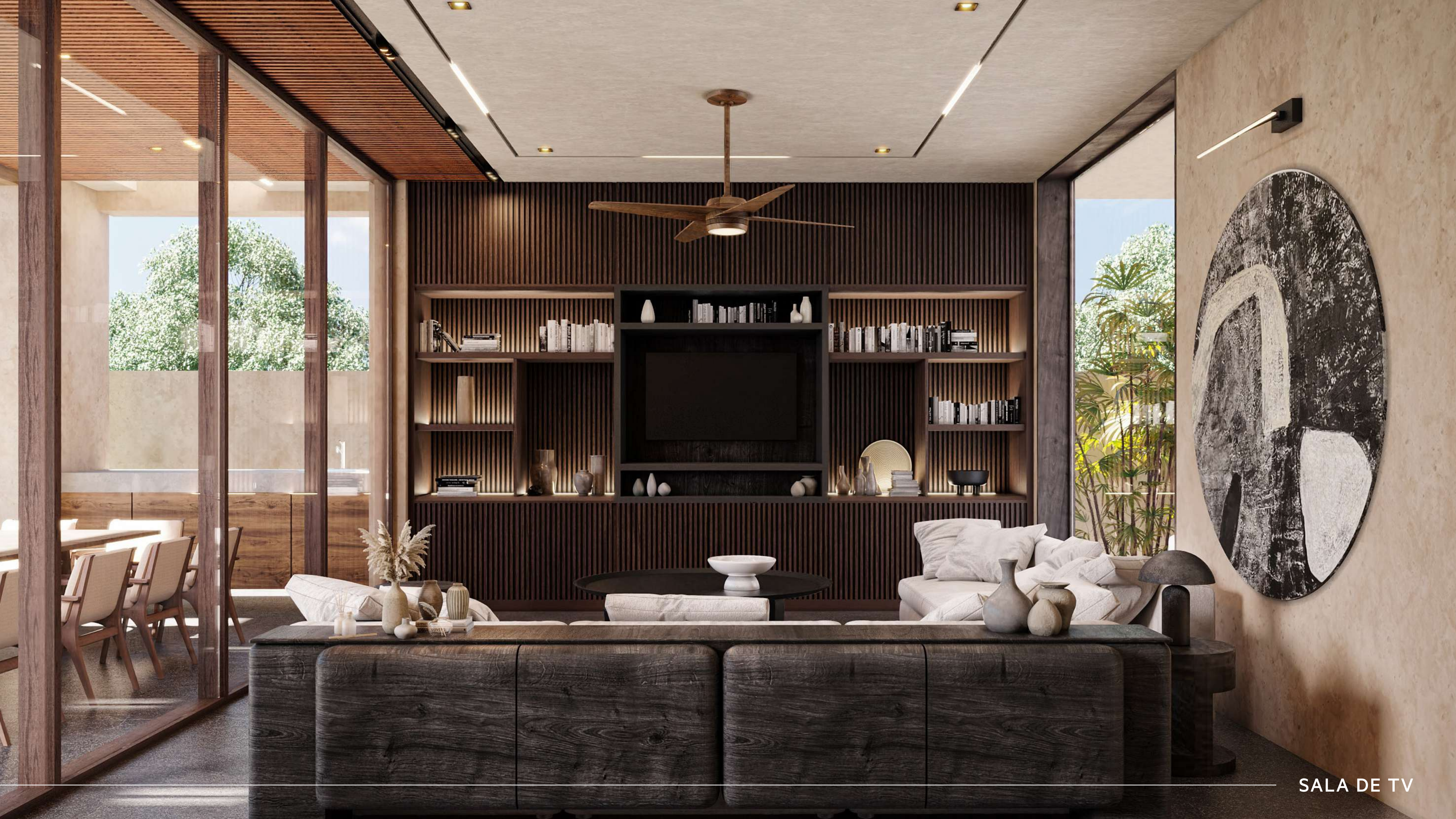
SALA DE TV