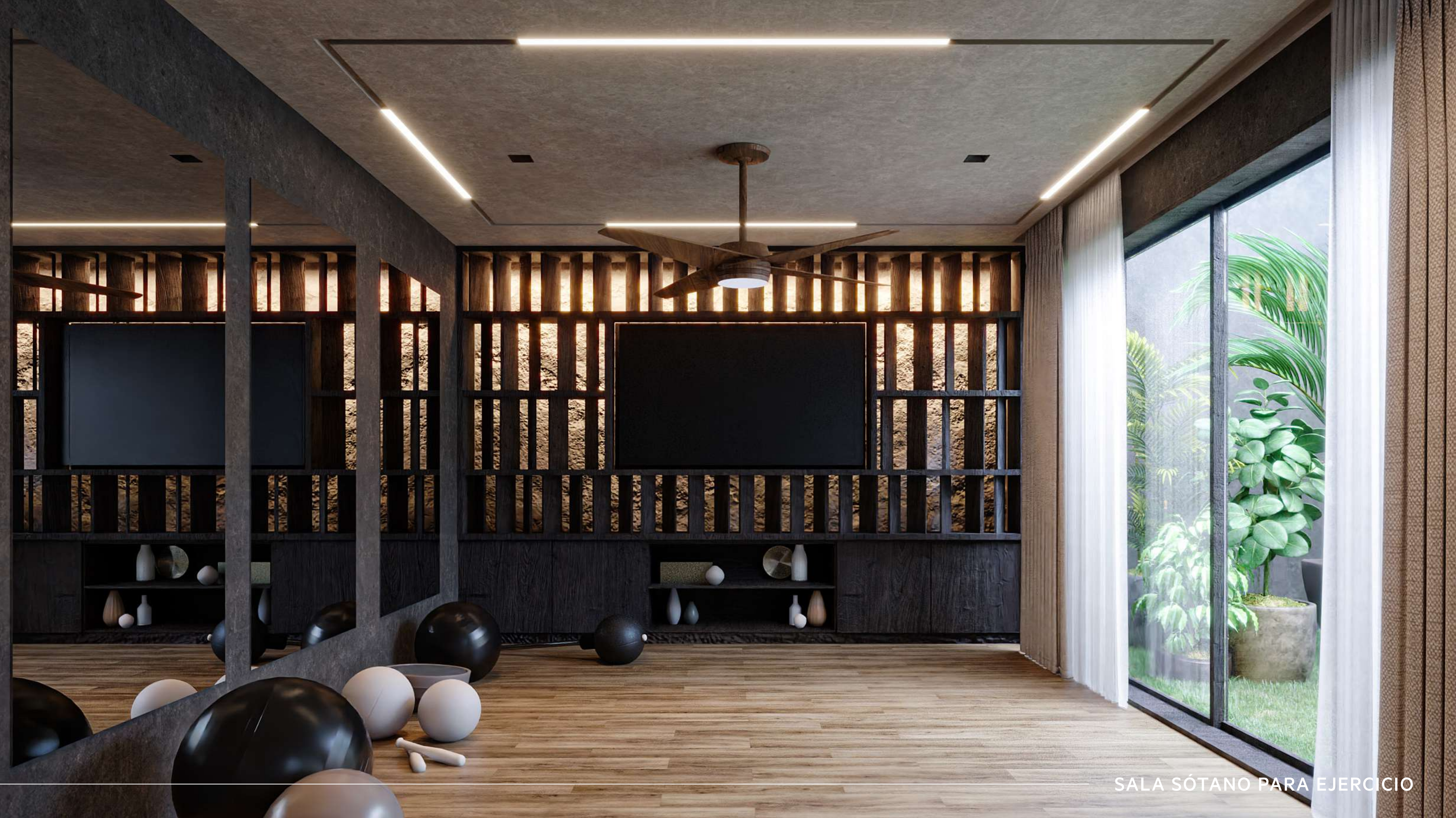
SALA SÓTANO PARA EJERCICIO