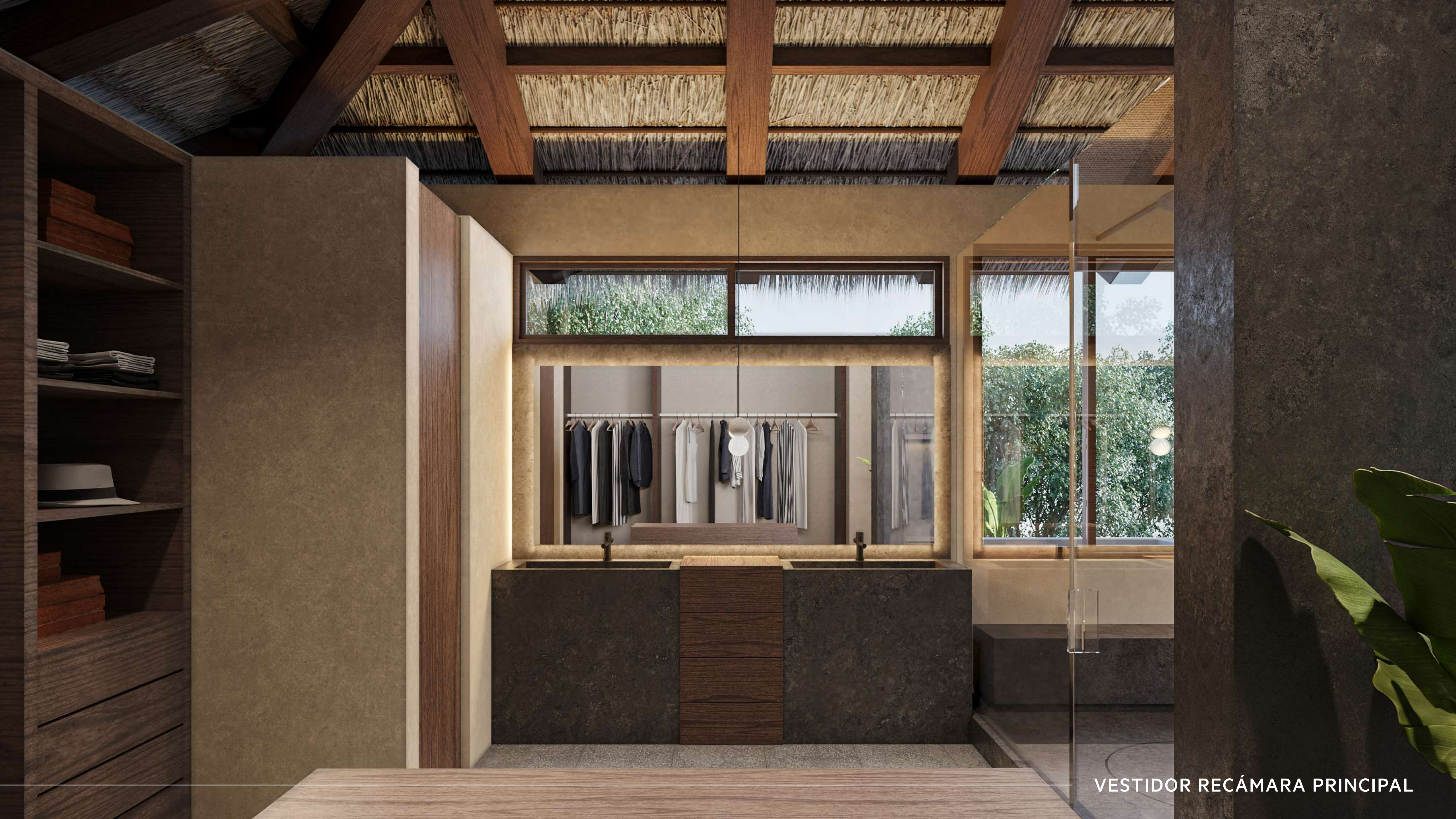
VESTIDOR RECÁMARA PRINCIPAL